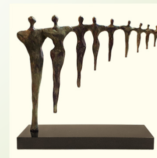
Organisatie met perspectief

Elk CR-lid heeft een of meer specifieke aandachtsgebieden met vastgestelde thema's. Hiermee streeft de CR naar spreiding van expertise en naar doelmatigheid.