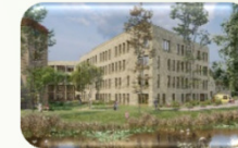
Bouw & Verbouw