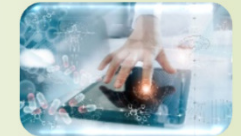
Passende & Digitale Zorg

Elk CR-lid heeft een of meer specifieke aandachtsgebieden met vastgestelde thema's. Hiermee streeft de CR naar spreiding van expertise en naar doelmatigheid.