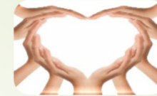
Zorg & Samen Beslissen

De CR vergadert maandelijks; het zgn. intern beraad. Hierin worden de overlegvergaderingen met de RvB voorbereid, worden conceptadviezen besproken en vastgesteld en worden andere relevante thema's besproken. In de even maanden – zes keer per kalenderjaar dus – vindt overleg plaats van de CR met de RvB en het bCMS. Zowel de gevraagde als de ongevraagde CR-adviezen komen hierin aan de orde, alsook de reactie van de RvB c.q. het bCMS hierop. Het overleg verloopt in grote openheid en in een constructieve sfeer.